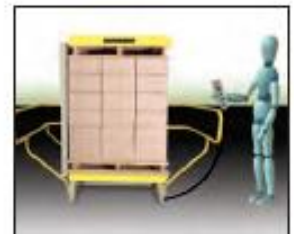
4. The entire cycle takes about a minute.