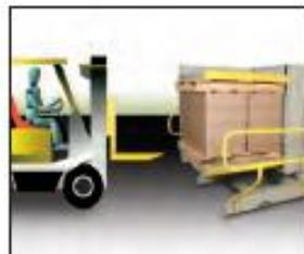
2. Place loaded pallet into rotator/inverter.