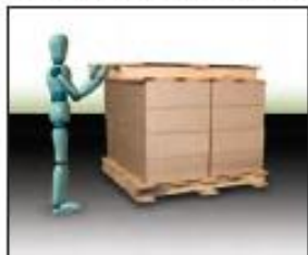
1. Add replacement pallet or slip sheet to top of load.