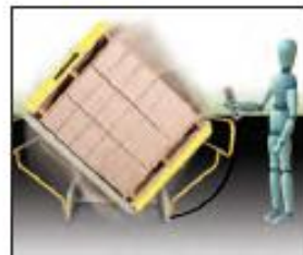
3. Use the remote control to clamp and rotate load in about 15 seconds.